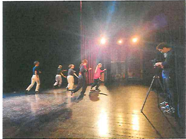
Grabación en el Teatro Lux