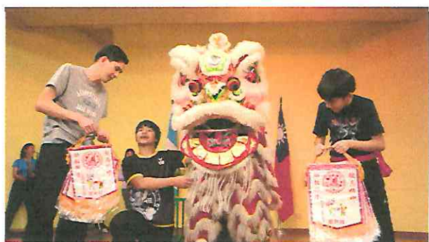
Ensayo de la danza de León Chino