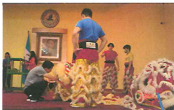
Ensayo de la danza de León Chino