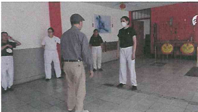
Gimnasio J .M. Jo