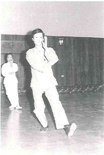
Estudio del pasado del Maestro.