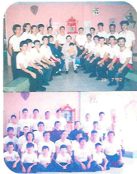
Historia del Maestro