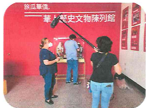
Museo de la Asociación China

Las danzas fueron grabadas en el escenario principal del Teatro Lux con la iluminación multicolor del teatro. Contamos con la asistencia del técnico de luces para crear ambientes con la luz y humo. La iluminación y el humo de las escenas fueron diseñadas para recrear el ambiente dentro de un volcán.