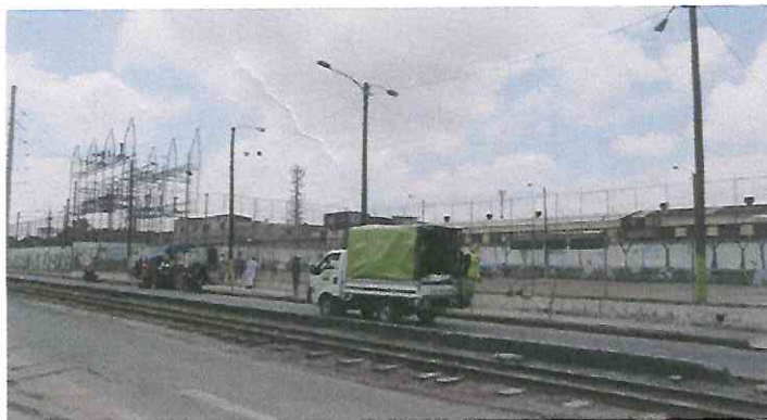
Barrio Gerona zona 1