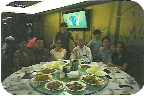
Reunión en Lai Lai