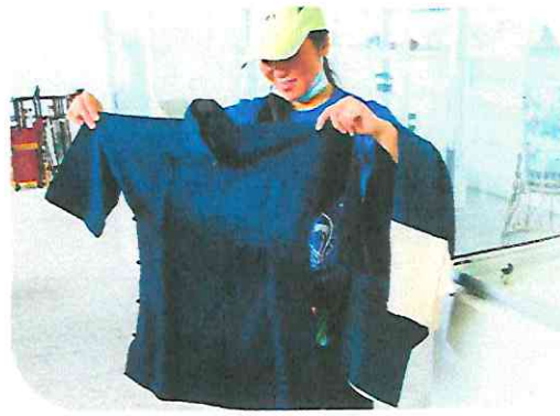
Entrevista con la comunidad en museo de la colonia China.