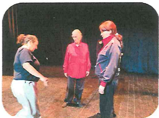
Ensayo con las actrices