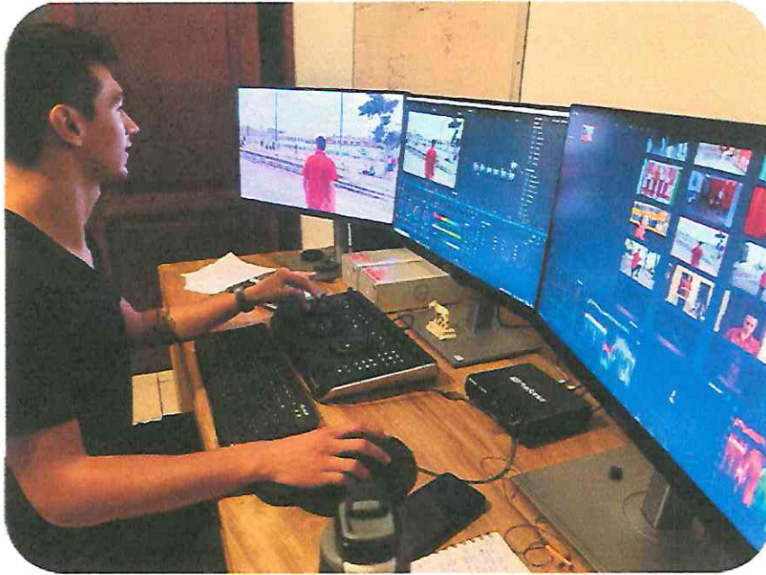
El proceso de color es muy detallista.