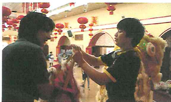
Ensayo de la danza de León Chino