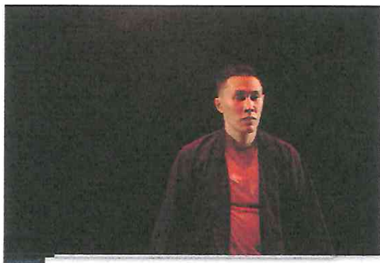
Ensayo de Movimientos en el Teatro Lux