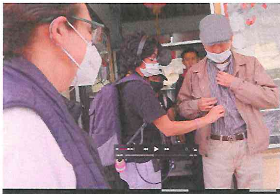
Grabación tienda Asia