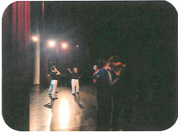
Grabación en el Teatro Lux