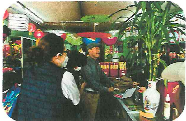
Grabación tienda Asia

También fuimos a grabar varios ensayos de la danza de león chino y también clases de Tai Chi, Shaolin y la danza del León Chino (celebrada en el día del año chino)